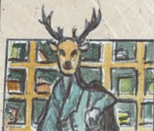
CABINET DE CURIOSITÉ