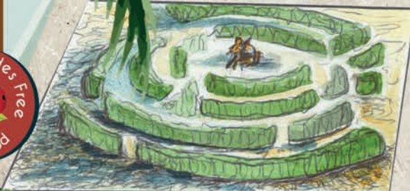
LABYRINTHE DU MINOTAURE