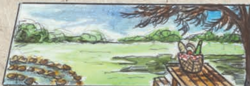
LABY CELTE - PIC-NIC